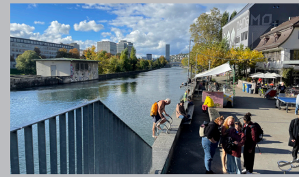
Zürich an der Limmat © Christina Simon-Philipp