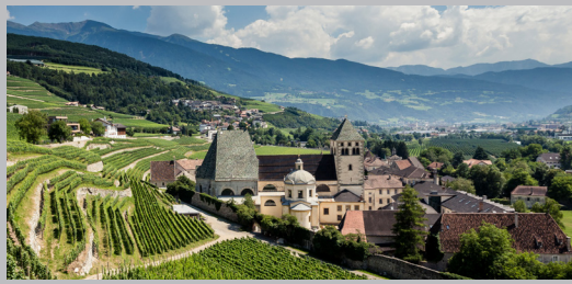
Kloster Neustift