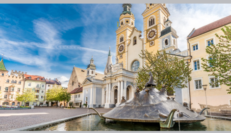
Domplatz Brixen