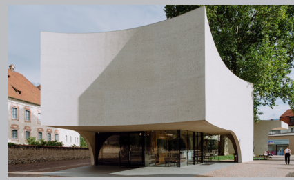
Büro von Brixen Tourismus