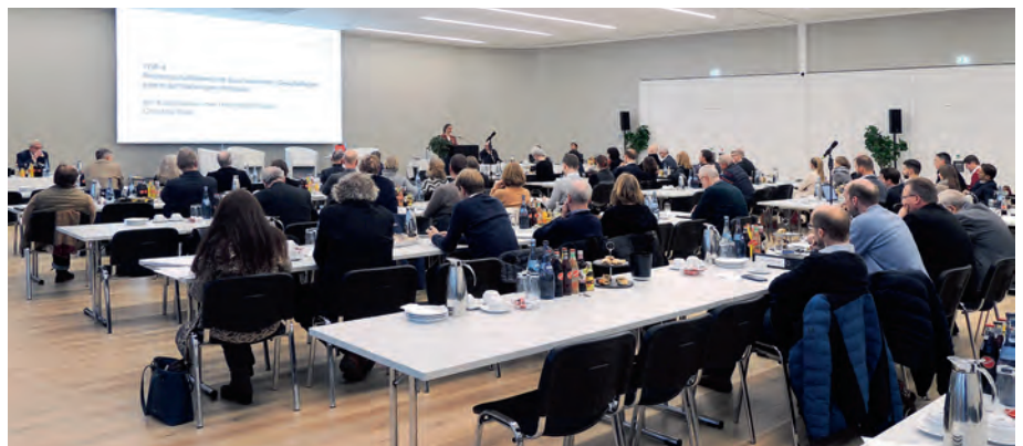
Rund 50 Gäste nahmen an der Kammerversammlung 2023 teil.

Das DABregional wird allen Mitgliedern der Architekten- und Ingenieurkammer Schleswig-Holstein mit Ausnahme der Ingenieur-Mitglieder zugestellt. Der Bezug des DAB regional ist durch den Mitgliedsbeitrag abgegolten.