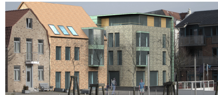
Wettbewerb Eckbebauung „Kleikuhle“, Husum Architekturbüro Johannsen und Fuchs, Husum

Die Kosten der im Rahmen eines sogenannten „Kleinen Verfahrens“ bzw. einer „Abgestimmten Mehrfachbeauftragung“ durchzuführenden, konkurrierenden Planungen betragen für die Auslober ca. 2.500 bis 4.000 EUR netto je Teilnehmer.