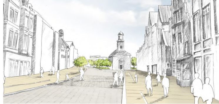
Freiraumgestaltung Shopping Center, Husum Arbos Freiraumplanung, Hamburg

Maßgeblich für die Vorbereitung und Ausgestaltung einer „abgestimmten Mehrfachbeauftragung“ ist die geschätzte Gesamtvergütung des zur Ausschreibung vorgesehenen Auftrages und das daraus resultierende Planungshonorar nach der Honorarordnung für Architekten und Ingenieure (HOAI), ohne Umsatzsteuer. Ist diese Abschätzung nicht möglich oder kann mit dem Verfahren kein Auftragsversprechen gegeben werden, so kann für einfache, nicht zu umfangreiche und wenig komplexe Aufgabenstellungen eine „abgestimmte Mehrfachbeauftragung“ nach den folgenden Grundregeln durchgeführt werden. Das Verfahren ist grundsätzlich mit der Architekten- und Ingenieurkammer Schleswig-Holstein (AIK S-H) abzustimmen und eine Registrierung zu erteilen.