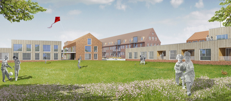
Gutachterverfahren Pestalozzischule Trommelberg, Husum Meyer Steffens Architekten + Stadtplaner, Lübeck