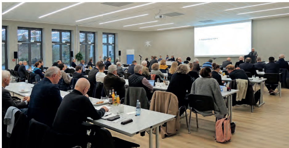
Die Kammerversammlung bietet jährlich Rückblick und Ausblick | AIK S-H

Das DABRegional wird allen Mitgliedern der Architekten- und Ingenieurkammer Schleswig-Holstein mit Ausnahme der Ingenieur-Mitglieder zugestellt. Der Bezug des DAB regional ist durch den Mitgliedsbeitrag abgegolten.