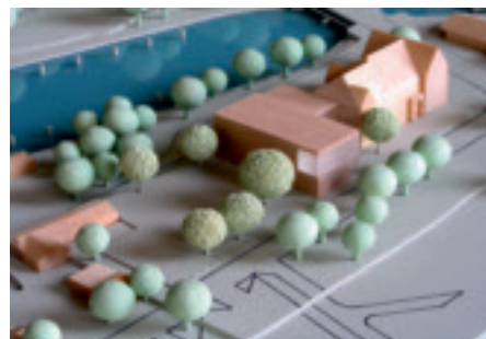
martinoff architekten / Jurij Martinoff, Hamburg koeber Landschaftsarchitektur, Stuttgart skm-haustechnik GmbH, München