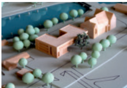
JK-Architekten GBR Jastrzembki Kotulla, Hamburg Sebastian Jensen Landschaftsarchitektur, Hamburg bow ingenieure GmbH, Braunschweig