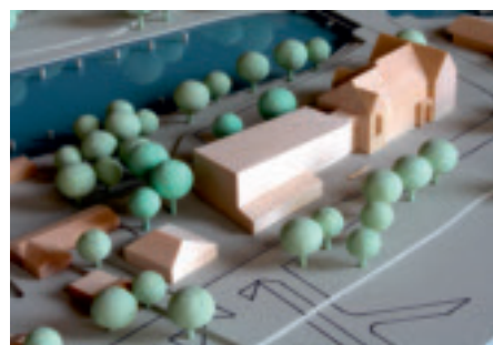
Prof. Bernhard Winking Architekten BDA, Hamburg LA.BAR Landschaftsarchitekten bdla, Berlin HKP Ingenieure GmbH, Hamburg

für das Verfahrensmanagement: dietrich hartwich - genius loci architekturcontor, hamburg