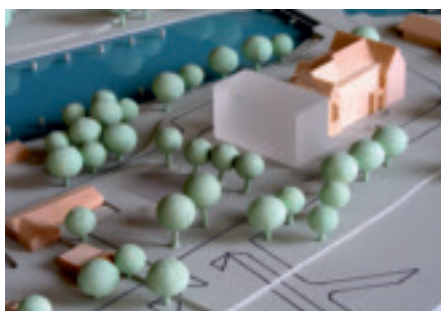
Sunder-Plassmann Architekten, Kappeln Topotek 1 Gesellschaft von Landschaftsarchitekten mbH, Berlin WINTER Beratende Ingenieure für Energie- und Gebäudetechnik GmbH, Hamburg