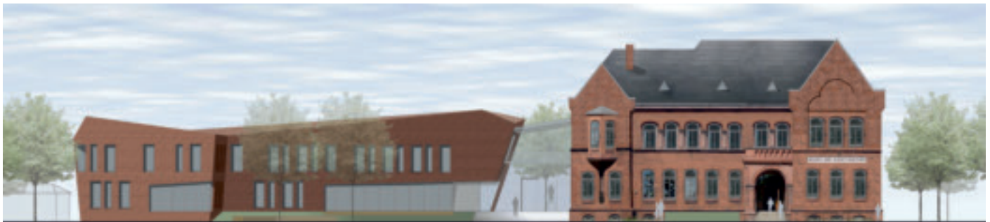
Ansicht von Süden M 1:200