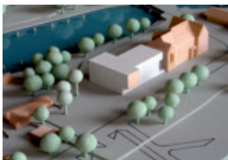
me di um Architekten Roloff . Ruffing + Partner, Hamburg Meyer Schramm Bontrup, Freie Garten- und Landschaftsarchitekten Partnerschaft BDLA, Hamburg HIS Intelligent House Solutions GmbH & Co. KG, Hamburg