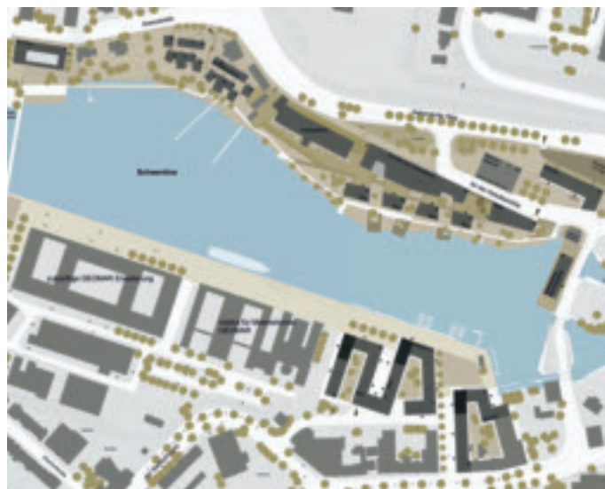
Entwurf Zastrow+Zastrow , Kiel

Die Beschränkung des Erweiterungsbaukörpers auf die zur Verfügung stehenden Grundstücke würde die Realisierbarkeit vermutlich deutlich erleichtern.