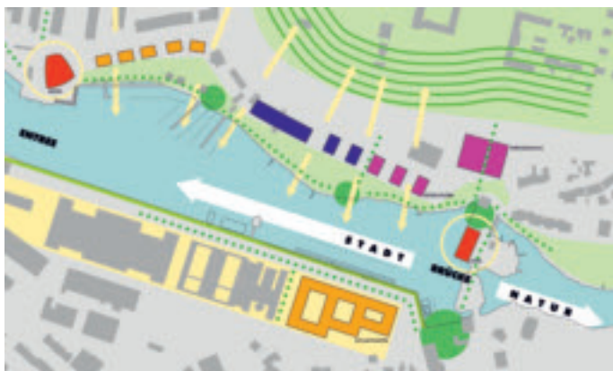
Entwurf: Bock „Schulz +Partner, Kiel

Der Gegensatz von landschaftlichem Schwentinental und dem industriell/maritim geprägten Mündungsbereich wurde von allen Verfassern thematisiert, ebenso wie die unterschiedlichen städtebaulichen Charakteristika der beiden Uferseiten. Dabei kam es allerdings für die verschiedenen Teilgebiete zu sehr unterschiedlichen Lösungen.