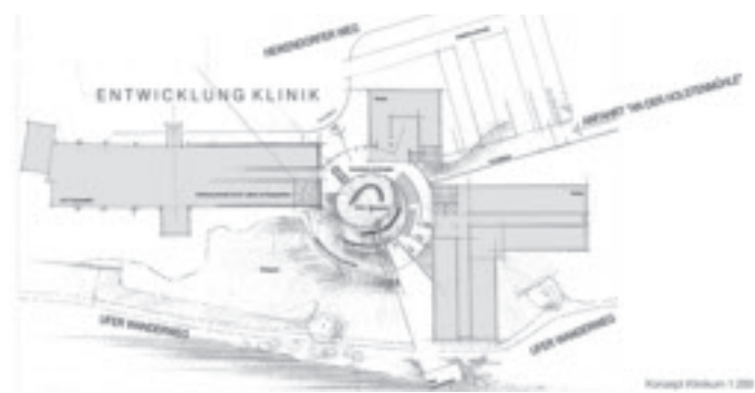
Entwurf Klinikerweiterung: Studio 42, Neumünster

Die Art des Verfahrens war der komplexen Aufgabe angemessen und setzte das Preisgericht in die Lage, die vielfältigen Ideen der Verfasser zu würdigen und zu berücksichtigen. Das Stadtplanungsamt Kiel als Auslober des Wettbewerbes hat nun eine gute Grundlage zur Fortschreibung ihrer Bauleitplanung, die im Herbst 2010 eingeleitet wird.