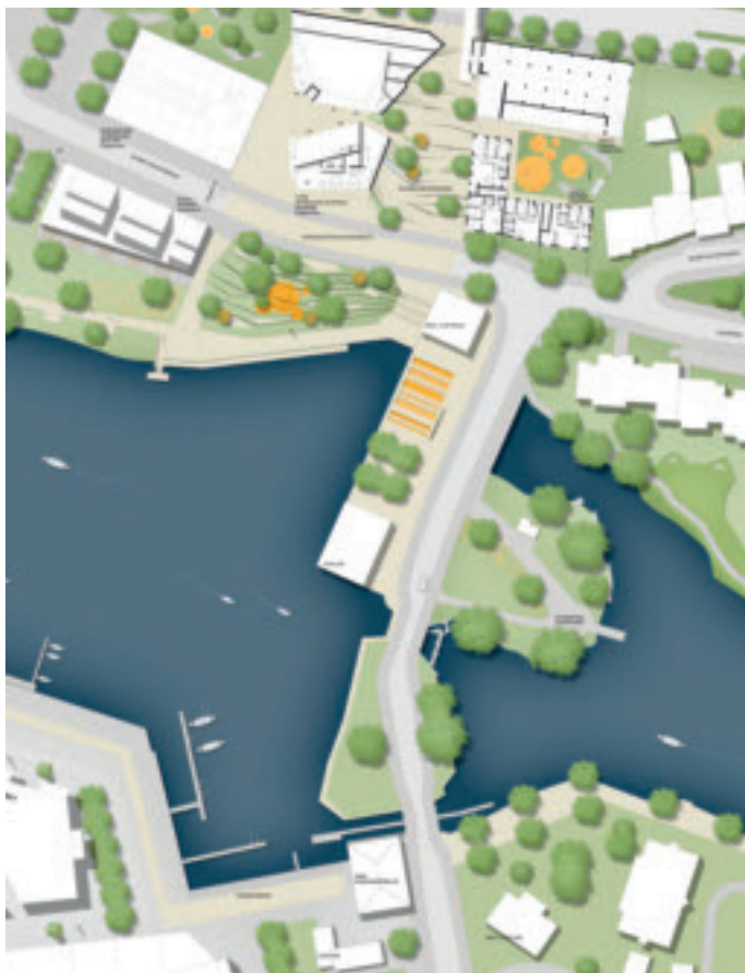
„Turbinenpark“ bei den Alten Schwentinebrücken. Entwurf: Wieder Architekten, Kiel

Es wird empfohlen, keine spürbare Bebauung auf der alten Schwentinebrücke zu entwickeln, da dadurch der vorhandene Grünzug zu stark unterbrochen würde. Der vorhandene Kontrast zwischen städtischen Uferbereichen und natürlichen Flussufern im Osten soll erlebbar bleiben. Eine urbane Intervention in kleinerem Rahmen erscheint vor dem Hintergrund der historischen Situation gut vorstellbar. Dazu liegen verschiedene in sich schlüssige Alternativen vor.